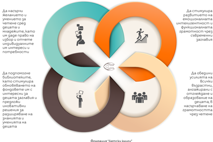
Фигура 1. Цели на Награда „Бисерче вълшебно“